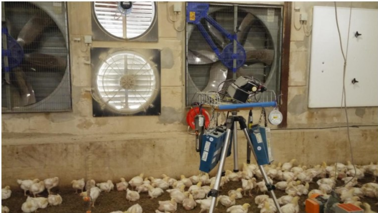
Figuur 3 Meten van de fijnstofconcentratie in een vleeskuikenstal

Met betrekking tot fijnstof en pluimvee zijn er nog diverse kennisleemtes, zoals bijvoorbeeld de risico's van pluimveestof relatief ten opzichte van andere fijnstofbronnen voor de humane gezondheid. Invulling van die leemtes kan consequenties hebben voor de prioritering van investeringen in de reductie van emissie van fijnstof. Daarnaast is behoefte aan innovatie op systeem-, technisch- en managementniveau om te komen tot een meer integrale aanpak van het staklimaat en de beheersing van emissies.