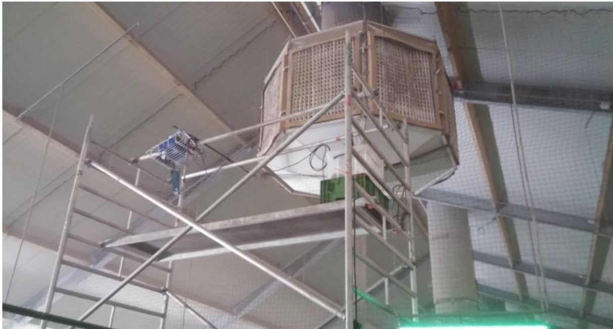
Figuur 1 Opstelling meetapparatuur fijnstof bij een droogfiltersysteem in een leghennenstal