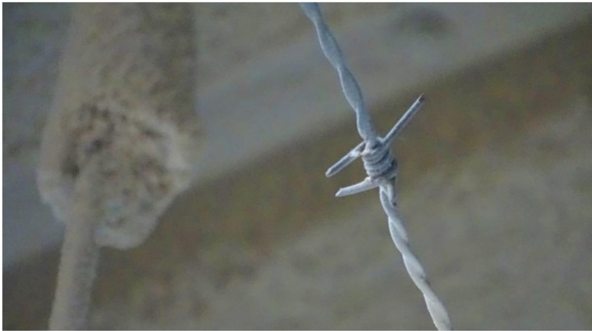
Figuur 2 Stofafzetting bij een fijnstofreducerende techniek